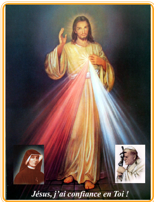
Obraz Miłosierdzia Bożego namalowany przez świętą Siostrę Faustynę