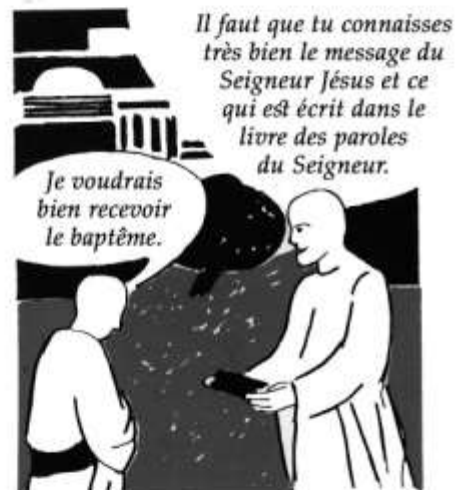
6- Il y a eu aussi des recueils des Paroles du Seigneur, des récits de guérisons, des paraboles, etc...

PUIS DANS LES VILLAGES LES PLUS IMPORTANTES : ANTIOCHE, ROME, JERUSALEM, EPHESE ET D'AUTRES. ON MIT EN ORDRE TOUS CES RECUEILS ; CELA DONNA LES PREMIERS RECITS COMPLETS DE LA MISSION DE JESUS CHRIST.