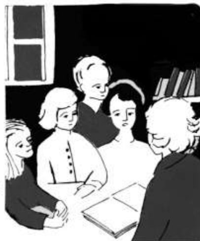
8- Aujourd'hui comme autrefois, le livre des Evangiles peut devenir une parole vivante.