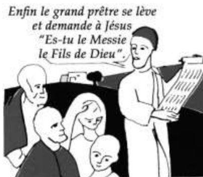
5- Le premier texte écrit fut sans doute le récit de la Passion du Seigneur.

AU FUR ET A MESURE QUE LES ANNEES PASSAIENT, IL FALLUT BIEN COMMENCER A METTRE PAR ECRIT LES PAROLES DU SEIGNEUR, ET LE RECIT DE SES ACTIONS.