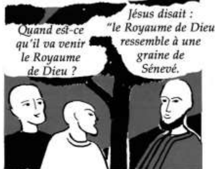
2- Ceux qui enseignaient les nouveaux disciples leur rappelaient souvent des paroles ou des actions de Jésus.

JESUS N'AVAIT RIEN ECRIT. AUSSI AU DEBUT, ON RACONTAIT LES PAROLES ET LES ACTIONS DE JESUS COMME ON S'EN SOUVENAIT, ET QUAND ON EN AVAIT BESOIN.