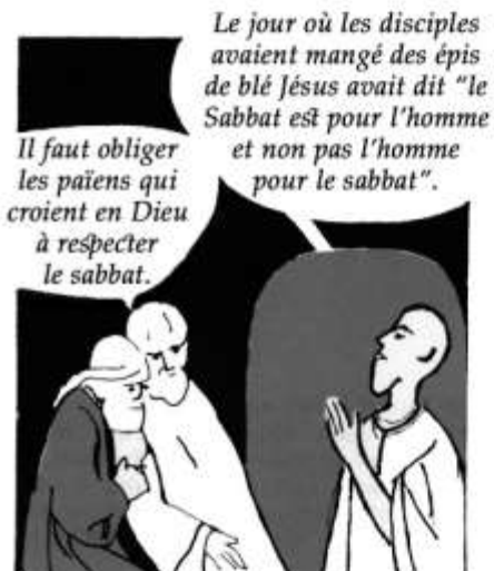
4- Quand ils discutaient dans les synagogues avec des Juifs, ils rappelaient aussi les paroles et les actions de Jésus.

AU FUR ET A MESURE QUE LES ANNEES PASSAIENT, IL FALLUT BIEN COMMENCER A METTRE PAR ECRIT LES PAROLES DU SEIGNEUR, ET LE RECIT DE SES ACTIONS.