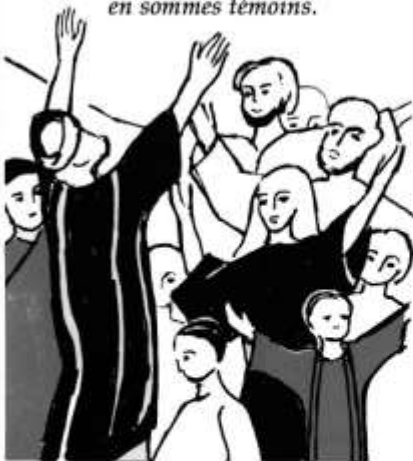
1- Tout commence le jour de la Pentecôte

Dieu l'a ressuscité nous en sommes témoins.